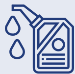
art. 1 nonies

1 Vous devez vérifier si votre produit relève des catégories suivantes visés par les sanctions :