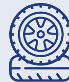
art. 1 novodecies

2 Une fois que vous avez déterminé le classement de votre bien, deux cas de figure peuvent se présenter :