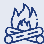
art. 3 undecies