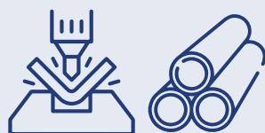
art. 3 octies