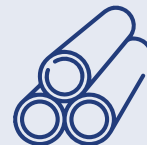
art. 1 octodecies