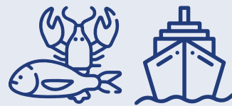
art. 3 decies