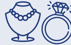
art. 3 sexdecies