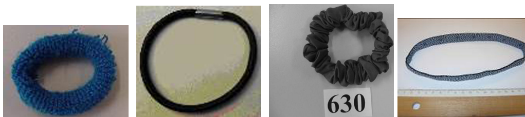
1. Attache pour cheveux de type «chouchou» 2. Attache pour cheveux de type «chouchou» 3. Attache pour cheveux de type «chouchou» 4. Serre-tête