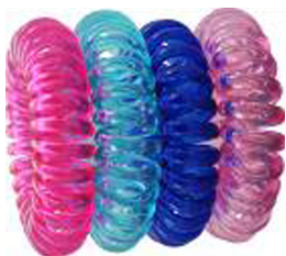
1. Attache pour cheveux de type «chouchou»