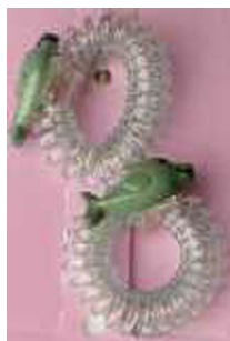
2. Attache pour cheveux de type «chouchou»