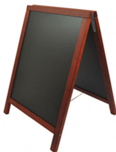
Tableau noir d'extérieur

Exemple de tableau d'affichage extérieur à classer dans la position 9610: